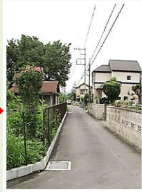
浅間 入間市境 側溝埋め、道路拡幅