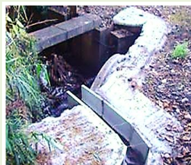
下川崎 排水口破損修理