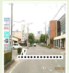
栄町、緑町 横断歩道設置