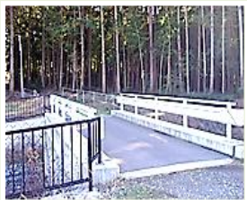
芦荻場 橋掛け替え