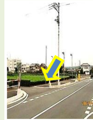
双柳 双柳小西 信号機設置