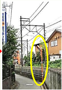
柳原 カブミラー設置