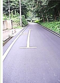
下川崎→芦荻場 道路、路面整備