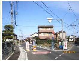
笠縫 画整理:道路改良