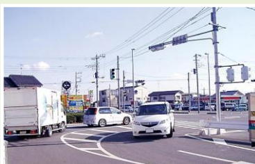
④ 299号中山陸橋青木地区相互通行に