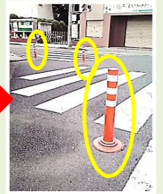
東町 東飯能駅西口 八高屋旅館脇歩道