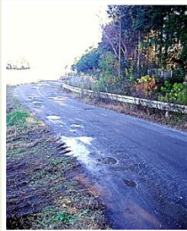
下川崎 生活クラブ裏舗装