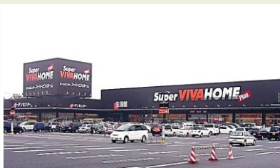
① 企業業誘致の実現

自分たちでできることは自分たちでまちづくりを。まちづくりは大人も子供も、地域一体で。