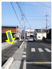
双柳 県道: 歩道設置