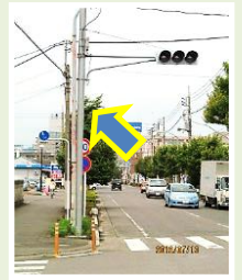
緑町,双柳,栄町 歩行者用 信号機設置