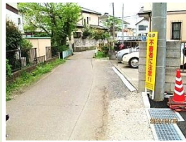
岩沢 六道地区:冠水対策