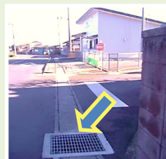
平松 下水排水改善