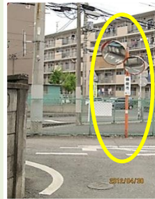
富士見地区カブミラー設置