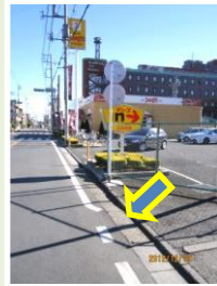
双柳 グリーンベルト設置