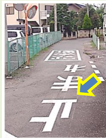
富士見地区路面標示