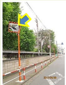
富士見地区カブミラー設置