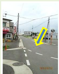
浅間 道路拡幅整備