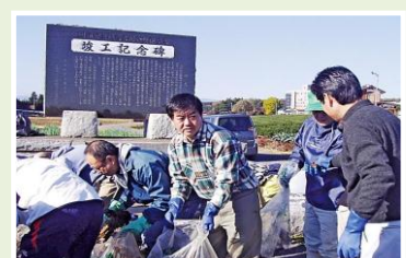
⑦ 地元の人たちと南小畦川の清掃