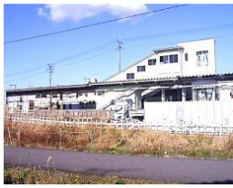
元加治駅 南口開設