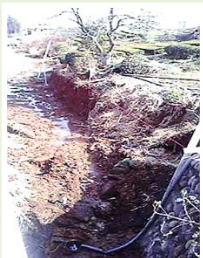
小久保 護岸壁設置 南小畦川