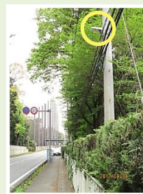
芦荻場 防犯灯設置