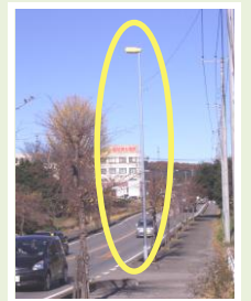
下加治 県道: 街路灯設置