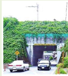
阿須 県道:ガード拡幅