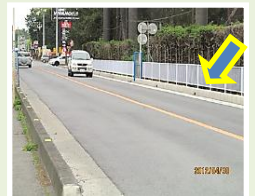
芦荻場 県道: 歩道整備