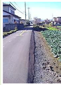
下加治、双柳 境道路 路面整備&路肩整備