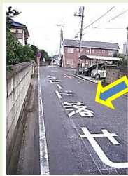
緑町、双柳 路面標示