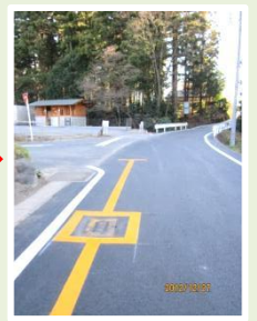
芦荻場 自治会館前 道路、路面整備